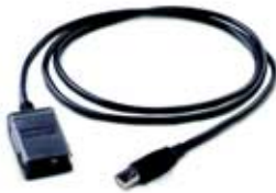
U5481A IR-USB 电缆