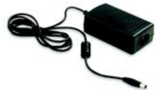
U1780A 电源适配器和电源线 (按所在国)