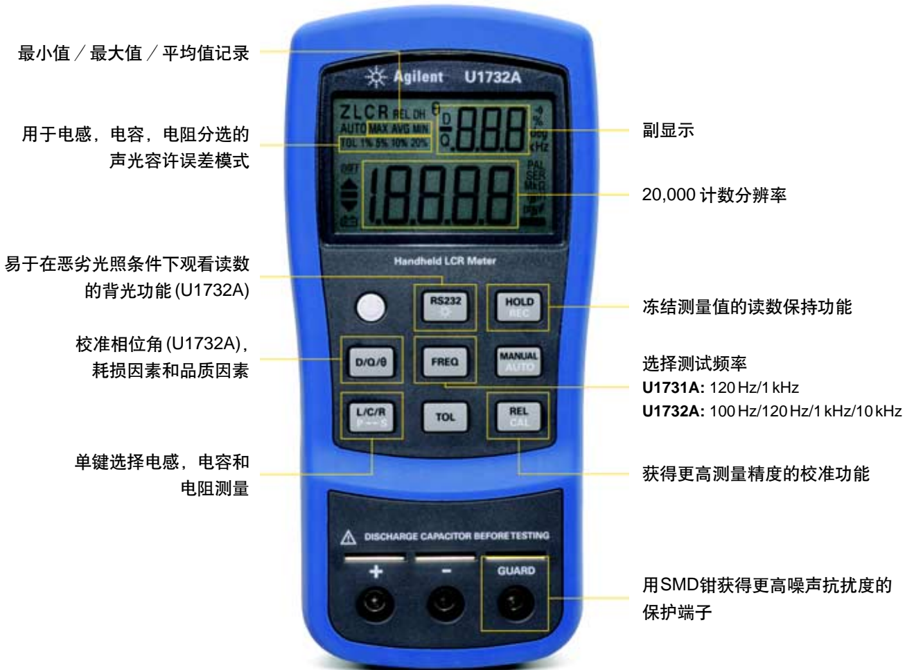
图 2: U1732A 前视图