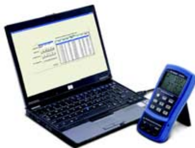
图 1: 当把 U1731A/32A 接到 PC 时, 就能使连续读数记录自动化

U1731A/32A 有坚固的铸模外壳, 并按严格的工业标准进行测试。每一台 U1731A/32A 都有 3 年的保修期, 以保证您能完全相信经测试的元件。