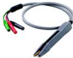
U1782A SMD 钳